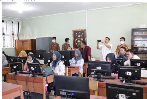
Gambar 1 Lab Komputer SMAN 3 Tangerang

SMAN 3 Tangerang dipilih sebagai tempat pelaksanaan karena peran pentingnya dalam pendidikan lokal dan sebagai pusat pertemuan yang cocok untuk aktivitas PkM. Di harapkan kegiatan ini akan memberikan manfaat yang berkelanjutan bagi masyarakat dan memperkuat ikatan antara lembaga pendidikan dan komunitas setempat. Dengan demikian, PkM di tanggal dan lokasi yang telah ditentukan ini merupakan langkah positif dalam upaya memajukan dan memberdayakan masyarakat melalui kolaborasi antara pendidikan dan komunitas.