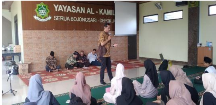
Gambar 3 Pemaparan Materi

Oleh karena itu, memberikan pemahaman dan pengetahuan tentang akuntansi serta pemenuhan kewajiban perpajakan kepada para mahasiswa tersebut dianggap penting dan sangat penting. Jadi, penerapan tata kelola atau akuntansi sangat penting bagi warga Yayasan Al-Kamilah di Bojongsari, Depok, Jawa Barat untuk mempertimbangkan proyek masa depan atau karir profesionalnya.