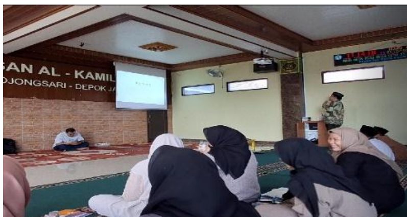
Gambar 1 Materi Akuntansi Perpajakan

Langkah 2: Siswa mempunyai kesempatan untuk mendiskusikan materi yang dibagikan kepadanya. Kesempatan bertanya dan memperoleh jawaban diberikan untuk memperjelas keraguan dan