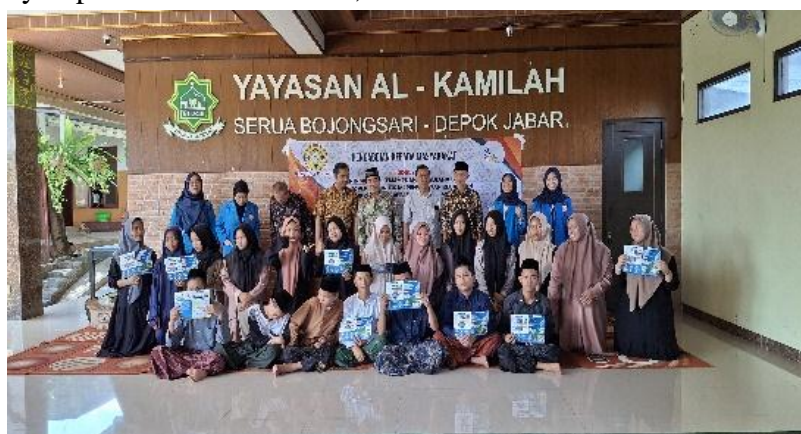
Gambar 4 Foto Bersama

rencananya akan dibentuk wadah atau kolektif warga Yayasan Al-Kamilah, Bojongsari, Depok, Jawa Barat. Misi yang terakhir adalah untuk berdebat dan bertukar pikiran mengenai semua isu yang berkaitan dengan akuntansi dan perpajakan. Selain itu, kelompok atau forum ini akan diorganisir oleh tim PKM dengan tujuan untuk digunakan sebagai alat pemantauan dan perencanaan jangka panjang atau berkelanjutan. Selain itu, kegiatan PKM yang akan dilaksanakan kedepannya juga mempunyai tujuan yang lebih luas. seperti bagaimana bisnis dikelola terkait penagihan, penagihan, dll (Tejaningrum, 2015).