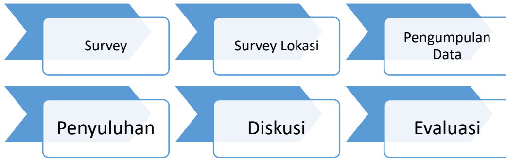
Gambar 3. Metode Pelaksanaan

Metode pelaksanaan merupakan landasan dalam melaksanakan program pengabdian kepada masyarakat agar dapat berjalan secara sistematis, terstruktur, dan terarah. Setelah proses observasi lapangan dan identifikasi permasalahan dilakukan, maka akan dilakukan perancangan solusi. Selanjutnya solusi yang menjadi yang telah direncanakan akan ditawarkan kepada mitra. Metode yang akan digunakan dalam program ini ditunjukkan pada Gambar 3.