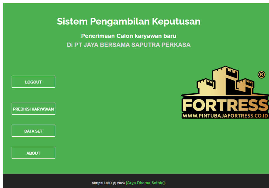
Gambar 2. Tampilan Menu