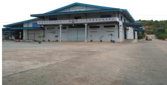
Gambar 1. PT Hasil Laut Sejati (HLS)

Penelitian ini dilakukan selama 3 bulan, terhitung dari bulan Maret 2020 sampai Juni 2020. Dan dilaksanakan di PT Hasil Laut Sejati (HLS), Batam, Kepulauan Riau. Seperti pada gambar 1, merupakan PT Hasil Laut Sejati (HLS) dan Gambar 2 peta wilayah Batam.