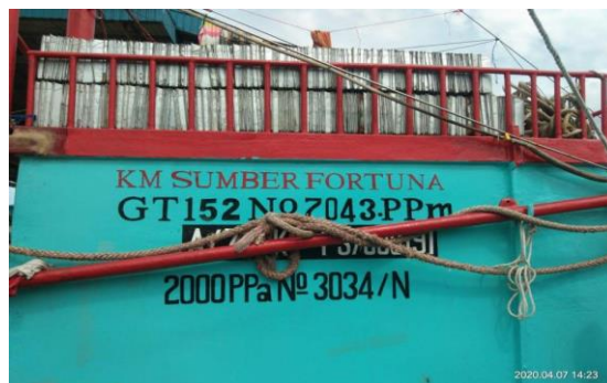
Gambar 4. Tanda Selar KM Sumber Fortuna

Pada pengambilan data Sistem pendingin mesin induk, penulis melakukan penelitian di kapal KM Sumber Fortuna, yang mana mesin induk KM Sumber Fortuna menggunakan