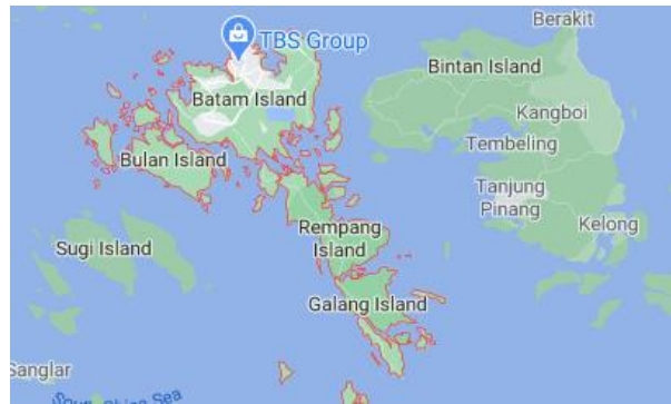
Gambar 2. Peta Batam

Metode penelitian yang dilakukan adalah memahami bagaimana cara kerja penukar kalor pada sistem pendingin diatas kapal. Adapun gambar dibawah ini merupakan penukar kalor.