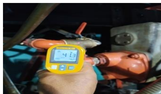
Gambar 6. Suhu Pipa Keluar air laut dari Heat Exchanger