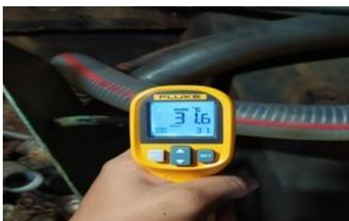
Gambar 5. Suhu Pipa Penyediaan air tawar