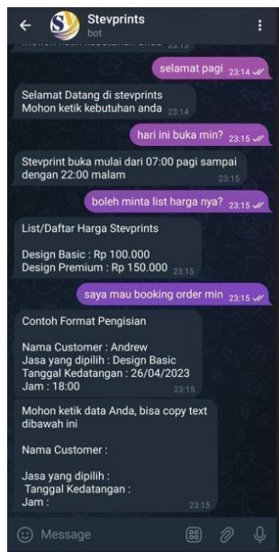
Gambar 2. Gambar Rancangan Tampilan Booking

Pada tampilan tersebut, diberikan contoh bagaimana seorang pelanggan menanyakan pertanyaan kepada bot , dan bot secara langsung memberikan jawaban sesuai dengan kategori yang telah diidentifikasi dan disimpan dalam database . Namun, ini hanya merupakan gambaran umum yang akan digunakan, karena kita memiliki kata-kata yang telah didaftarkan dan akan dijelaskan secara detail pada pengujian.