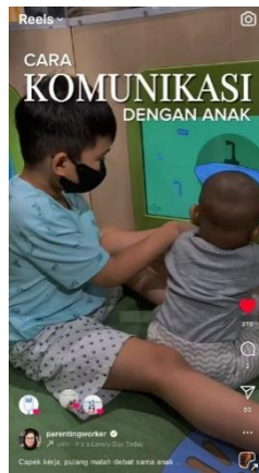
Gambar 5 Reels “Cara Berkomunikasi Dengan Anak Saat Lelah”

Konten ini memberikan panduan tentang cara berkomunikasi dengan anak ketika mereka melakukan kesalahan, khususnya di saat orang tua sedang merasa lelah. Dalam konten tersebut disampaikan pula rahasia komunikasi dari Nelson Mandela. Ketika ditanya, “How did you become such a good leader?” Mandela menjawab, “Because I learned to speak last.” Pesan yang ingin disampaikan adalah orang tua sebaiknya tidak langsung memberikan nasihat panjang lebar. Mulailah dengan meminta anak menceritakan kejadian yang mereka alami.