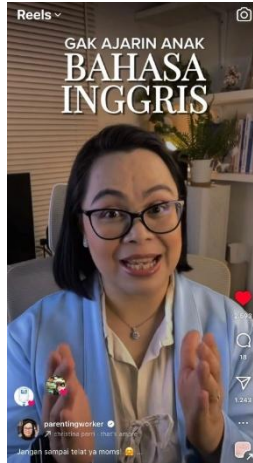
Gambar 3 Reels “Gak Ajarin Anak Bahasa Inggris dari Kecil”

Konten ini menekankan pentingnya penguasaan Bahasa Inggris agar anak di masa depan mampu bersaing secara optimal. Jika di masa lalu kemampuan berbahasa Inggris hanya dianggap sebagai nilai tambah, kini ketidakmampuan anak menguasai bahasa tersebut hingga dewasa berarti orang tua telah melewatkan “masa emas” pembelajaran bahasa. Mengacu pada studi di Scientific American , periode terbaik bagi anak untuk mengembangkan kemampuan bahasa, bahkan hingga mendekati tingkat penutur asli, dimulai sebelum usia 10 tahun hingga sekitar 17–18 tahun. Tentu saja, proses ini memerlukan metode pembelajaran yang tepat dan pendidik yang memahami cara mengajar anak dari usia dini hingga remaja. Kesulitan kerap muncul apabila orang tua yang sibuk harus mengajarkan sendiri di rumah. Karena itu, konten ini menyarankan agar selain memberikan bimbingan langsung, orang tua juga mempertimbangkan untuk mendaftarkan anak ke lembaga kursus bahasa Inggris yang sesuai guna mendukung pengembangan kemampuan berbahasa mereka.