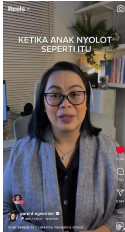
Gambar 1 Reels "Ketika Anak Nyolot Seperti Itu"

Konten ini menggambarkan situasi ketika anak menunjukkan sikap membantah atau berbicara dengan nada tinggi, namun orang tua tidak merespons dengan kemarahan ataupun membentak kembali. Menurut penjelasan Ibu Anne, cara paling tepat untuk menghadapi kondisi tersebut adalah dengan menerapkan metode Co-Regulation, yakni orang tua berperan sebagai penyeimbang emosi anak. Saat anak sedang meluapkan emosinya, orang tua dianjurkan untuk tetap tenang, menarik napas, tidak terpancing secara emosional, serta bersikap tegas namun tetap lembut. Anak kemudian diarahkan untuk mengungkapkan keinginannya dengan cara yang sopan. Pendekatan ini efektif karena anak belajar melalui contoh dan pola emosi yang ditunjukkan oleh lingkungannya. Konsep ini disebut Heart Coherence, yaitu kondisi ketika ketenangan dan kesadaran penuh (mindfulness) yang dimiliki orang tua dapat memengaruhi emosi anak melalui gelombang elektromagnetik dari jantung mereka. Dengan demikian, orang tua tidak hanya mengajarkan kesopanan, tetapi juga keterampilan dalam mengelola emosi dengan baik.