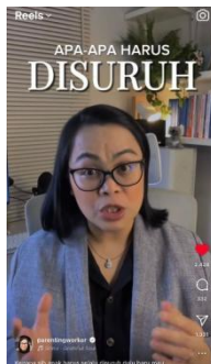
Gambar 7 Reels “Buat Moms yang Punya Anak Apa-Apa Harus Disuruh”

Konten ini mengajak orang tua untuk melakukan refleksi diri ketika mendapati anak kurang memiliki inisiatif. Ada kemungkinan, tanpa disadari, orang tua melakukan beberapa kesalahan dalam pola asuh. Misalnya, aturan yang diterapkan tidak konsisten, hari ini dilarang, tetapi keesokan harinya diperbolehkan, sehingga anak merasa bingung dan akhirnya cenderung menunda atau mengabaikan tugas. Selain itu, ketidakadilan dalam memberi contoh serta cara memberikan instruksi yang kurang tepat, seperti dengan teriakan, bentakan, atau ancaman, juga dapat memengaruhi sikap anak. Sebagai solusinya, orang tua