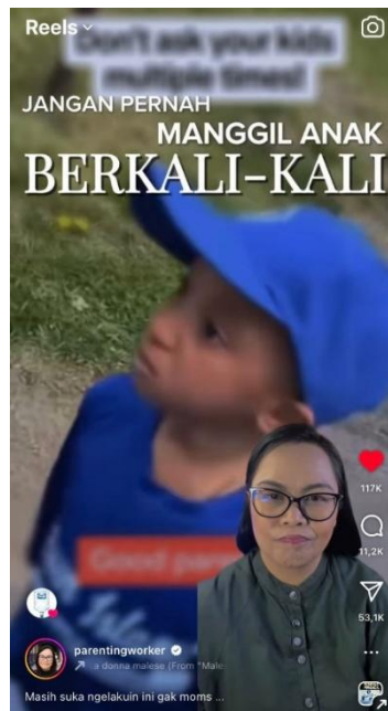
Gambar 8 Reels “Jangan Pernah Manggil Anak Berkali-kali”

Konten ini mengingatkan orang tua untuk tidak terbiasa memanggil anak berkali-kali hingga akhirnya marah, karena hal tersebut justru dapat berdampak negatif bagi anak. Membiarkan anak mengabaikan panggilan berulang kali sampai harus dimarahi bukanlah bentuk kesabaran, melainkan kebiasaan buruk yang tanpa sadar diajarkan kepada anak. Solusi yang dianjurkan adalah memanggil anak maksimal satu hingga dua kali saja. Jika anak tidak merespons, orang tua sebaiknya segera mendekat, menghilangkan distraksi, lalu menyampaikan maksud dengan nada yang tenang namun tegas. Dengan konsistensi, anak akan belajar untuk merespons panggilan orang tua dengan baik dan segera.