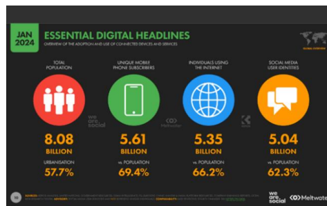
Gambar 1. 1 jumlah pengguna media sosial

Mengutip dari Nasrullah dalam Arafiq (2020:18), media sosial menjadi media komunikasi yang mengandalkan internet untuk penggunaannya. Sementara pendapat lain (Van Dijk dalam Purwa 2022:52) mengatakan bahwa media sosial merupakan media online yang digunakan untuk aktivitas dan berkolaborasi. Penggunaan media sosial yang terjadi secara masif dimanfaatkan untuk berbagi informasi, berinteraksi, dan membangun serta memperkuat hubungan sosial tanpa terhalang jarak dan waktu melainkan secara virtual melalui komputer maupun smartphone . Kini media sosial menjadi cara baru dalam berkomunikasi, sehingga hal lumrah jika hampir seluruh komponen masyarakat memiliki akun media sosial (Taufik, 2021).